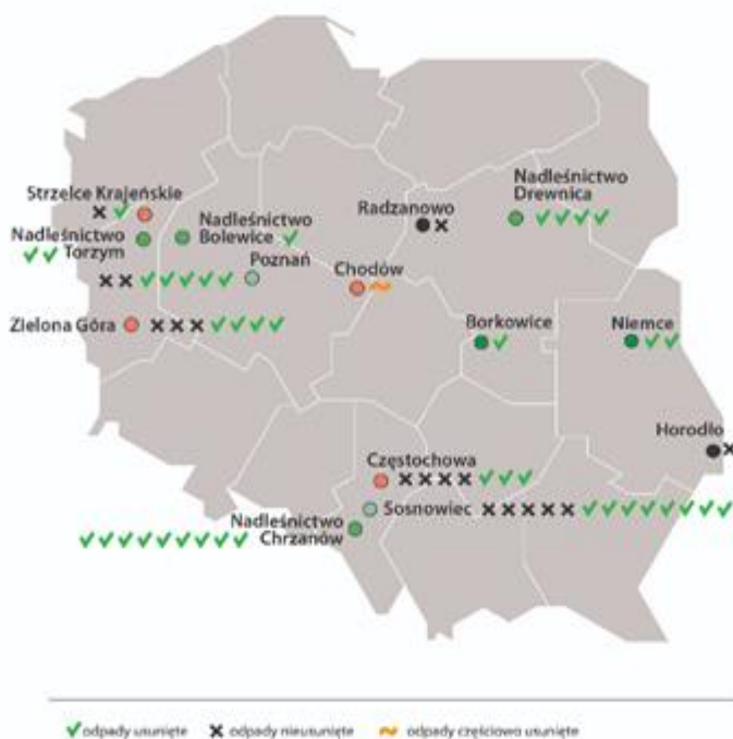
Odpady niebezpieczne na terenie kontrolowanych gmin i nadleśnictw